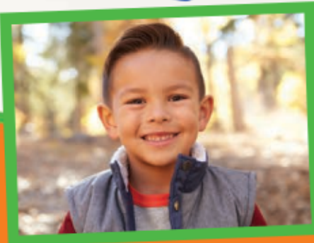
Helps Me Do Right!