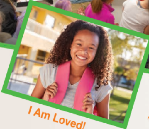
I Am Loved!